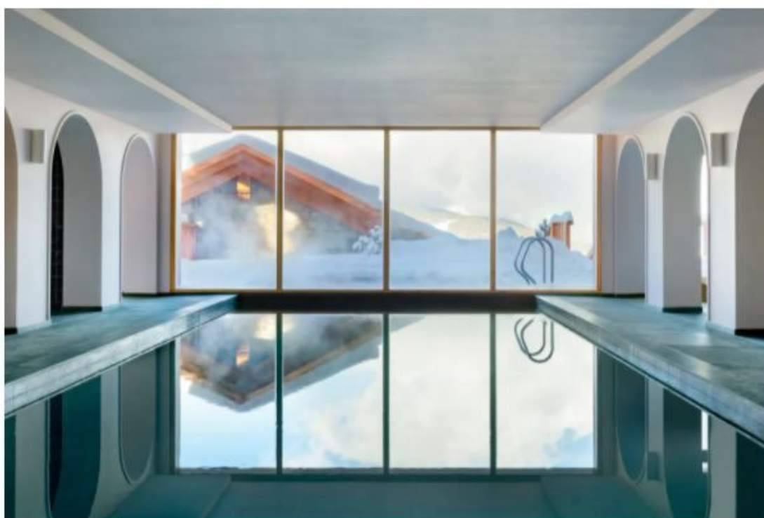
Le Coucou (Méribel)