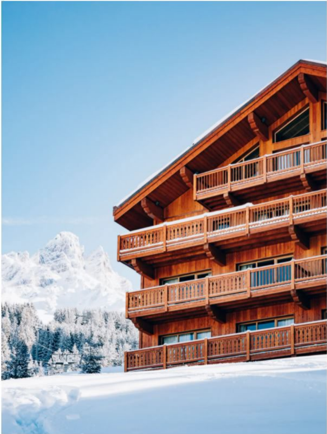
Le Coucou (Méribel). Jerome Galland