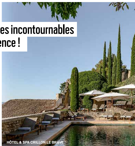
HÔTEL &amp; SPA CRILLON LE BRAVE