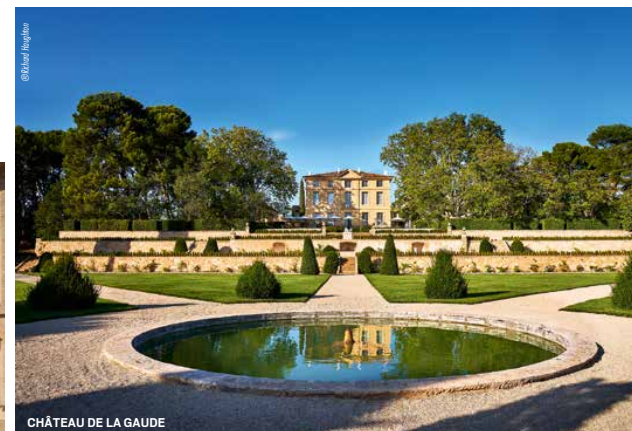
CHÂTEAU DE LA GAUDE

Place de l'Eglise - 84410 Crillon Le Brave. +33 4 90 65 61 61 crillonlebrave.com