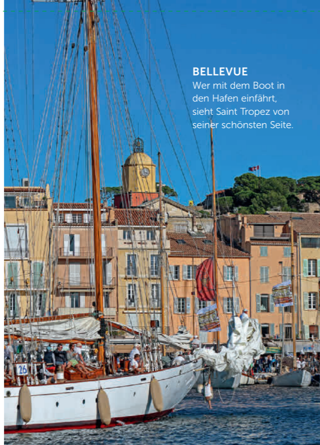
BELLEVUE Wer mit dem Boot in den Hafen einfährt, sieht Saint Tropez von seiner schönsten Seite.

Das Hotel mit zehn Luxus-Cabanas steht direkt am Pampelonne-Strand und gilt seit den späten 50er Jahren als Tummelplatz des Jetsets. Nach einer Rundumrenovierung ist es schicker und schöner denn je. epi1959.com