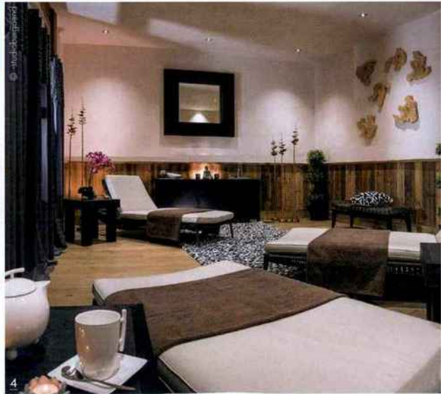
3/ CGH poursuit son développement avec l'ouverture prévue l'année prochaine du White Pearl Lodge & Spa, sa première résidence 5 étoiles, à La Plagne Soleil. 4/ Le groupe a également construit sa notoriété sur la qualité de ses 28 spas d'altitude Ô des Cimes, dotés de piscine intérieure chauffée, bain bouillonnant, sauna, hammam, salle de cardio-training...