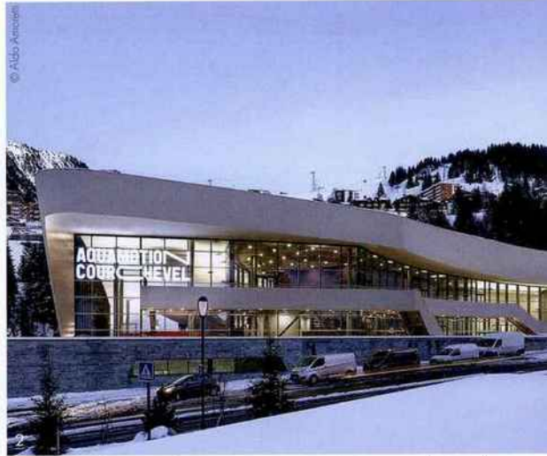
1/ Le nouveau centre de bien-être O'Dycéa s'inscrit au cœur de la politique de diversification et de montée en gamme de la station du Dévoluy. D'une surface de 1 400 m 2 , il propose un large panel d'activités aquatiques dédiées à tous les publics. 2/ Ouvert il y a 4 ans, Aquamation est, avec ses 15 000 m 2 de surface, l'un des plus grands et des mieux équipés d'Europe. Pour cette saison, l'offre a été enrichie avec notamment une nouvelle salle de 75 m 2 dédiée aux cours collectifs et de nouvelles offres pour l'accueil des enfants de tous âges.