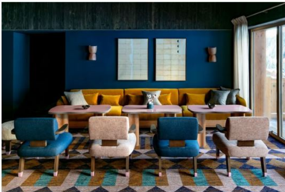
Au bar comme dans les chambres ou le restaurant, les couleurs claquent Jérôme Galland pour L'Express diX