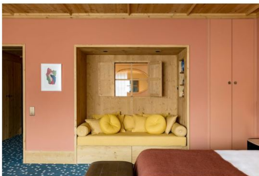
Spacieuses, les chambres jouent la carte de la fantaisie avec une moquette motif flocons de neige.