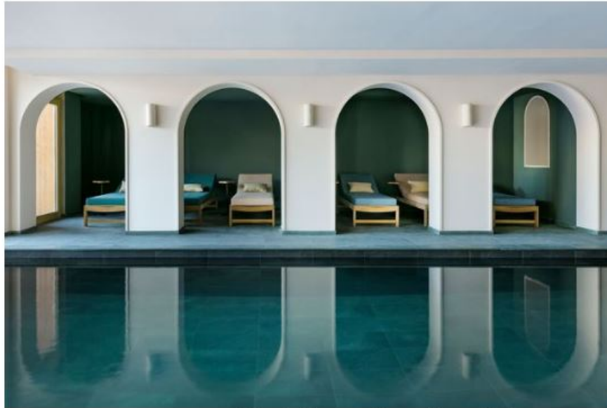
Le spa Tata Harper et sa piscine intérieure- extérieure dix

Depuis combien de temps, travaillez-vous sur ce projet ?