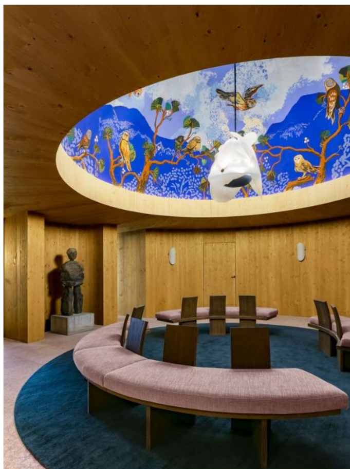
L'entrée de l'hôtel avec sa fresque et son coucou virevoltant, la mascotte de l'établissement Jérôme Galland pour L'Express d'IX

P. Y. : Oui, j'ai joué avec deux coloris chaleureux, le vert sapin et le terracotta, que j'ai associés à du jaune, du bleu, du rose. J'ai aussi dessiné tous les meubles, soit plus de 230 pièces différentes, et je me suis amusé à pousser plus loin la fantaisie et le décalage. Par exemple, j'ai créé les pieds des fauteuils en forme de pattes d'oiseaux ; dans les couloirs, les suspensions en verre givré reprennent la forme des glaçons et la moquette dans les chambres, le motif des flocons de neige.