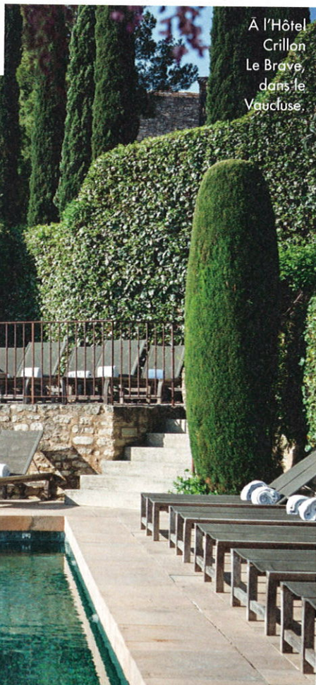
À l'Hôtel Crillon Le Brave, dans le Vaucluse.