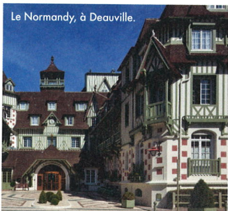
Le Normandy, à Deauville.