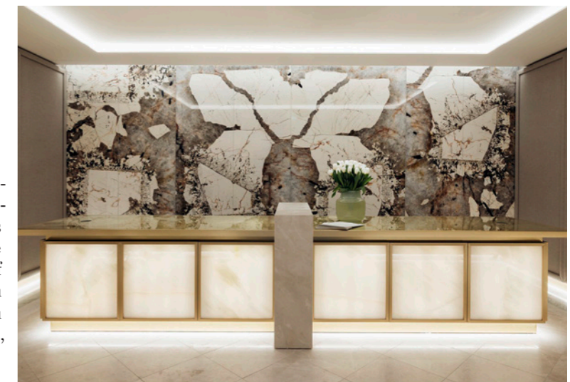
SINNBILDLICH Wie das gesamte Interieur ist auch die Rezeption cool und modern gehalten.

Dass Christian Louboutin Schuhe designen kann, weiss man. Dass ihm auch das Einrichten von Hotels liegt, ist hingegen neu. Sein erstes Hotelprojekt Vermelho liegt in Melides, einem Dorf in der portugiesischen Provinz Alentejo, und wurde in Zusammenarbeit mit internationalen Handwerkskünstlern ausgestattet. Der Mindestaufenthalt von zwei Nächten scheint im Sinne aller Beteiligten. DZ für 2 Nächte ab Fr. 840.-, vermelhohotel.com