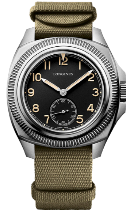
LONGINES Automatik- uhr Pilot Majetek mit Drehlunette und Armband aus Recyclingmaterial, Fr. 3500.-.

Vor fast neunzig Jahren kreierte Longines die Pilot Majetek: ein für die Luftfahrt konzipierter Zeitmesser, der sich schnell auch ausserhalb der Fliegerszene grosser Beliebtheit erfreute. Nun lässt die Uhrenmanufaktur das Modell auferstehen – ein bisschen ergonomischer, ein bisschen technischer, ein bisschen moderner. Und noch immer extrem cool. longines.com