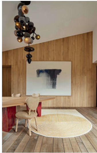
Tapis PLY de MUT Design . 100% laine vierge, 204x300 cm. 2'300 CHF. Gan gan-rugs.com