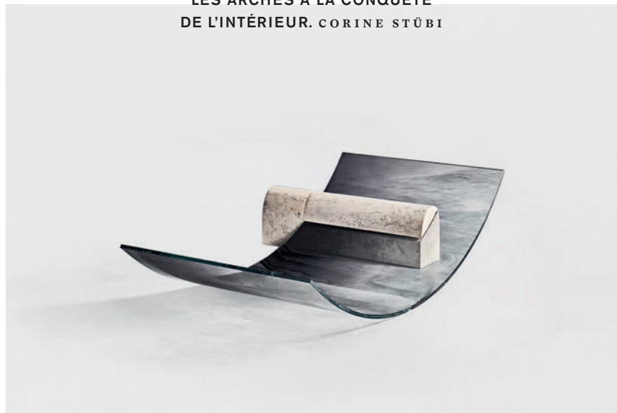
Chaise longue en verre courbé et travertin, de la série NO FEAR OF GLASS de Sabine Marcelis pour SIDE GALLERY. Édition limitée de 7+1 AP. side-gallery.com

LES ARCHES À LA CONQUÊTE DE L'INTÉRIEUR. CORINE STÜBI